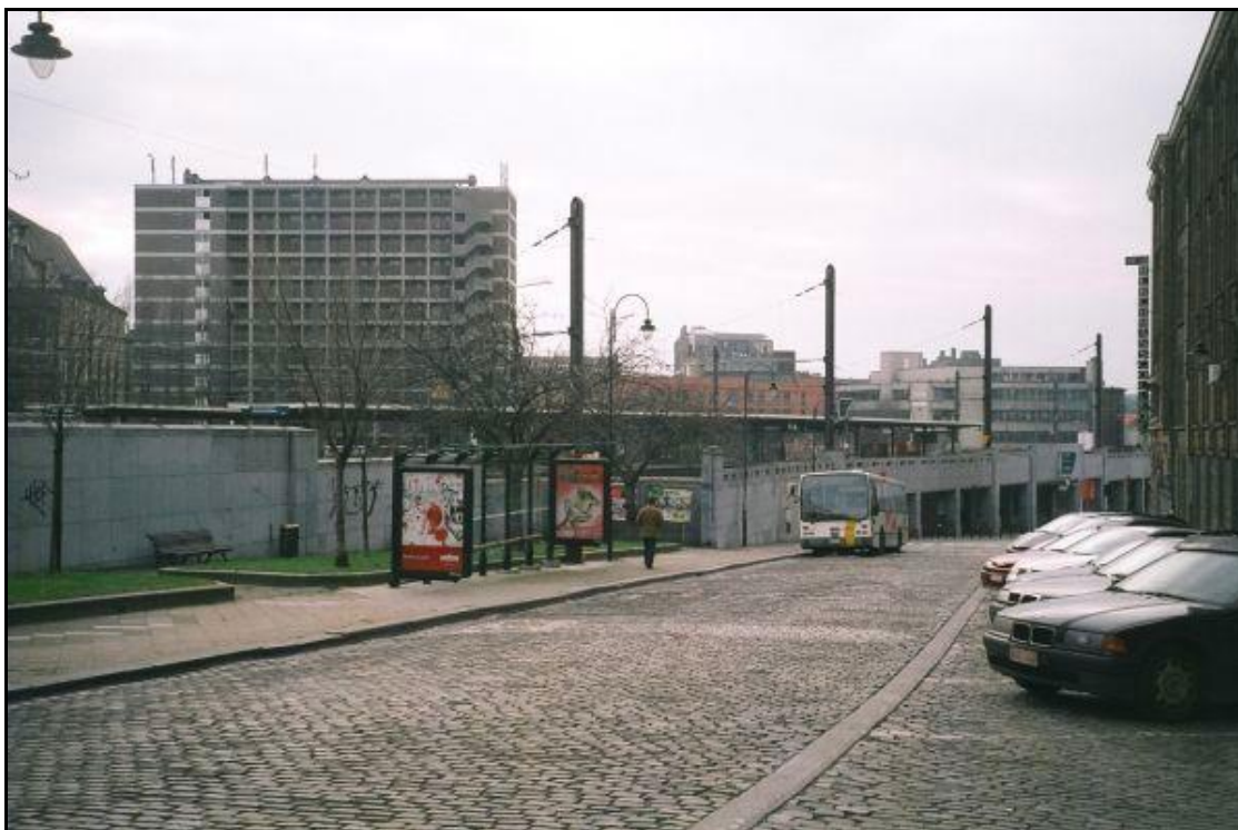
De Ursulinenstraat, met links het Station Brussel-Kapellekerk en de Noord-Zuid Verbinding, en rechts, de hoofdingang van het Sint-Jan Berchmanscollege, ter hoogte van de voorbijrijdende bus.