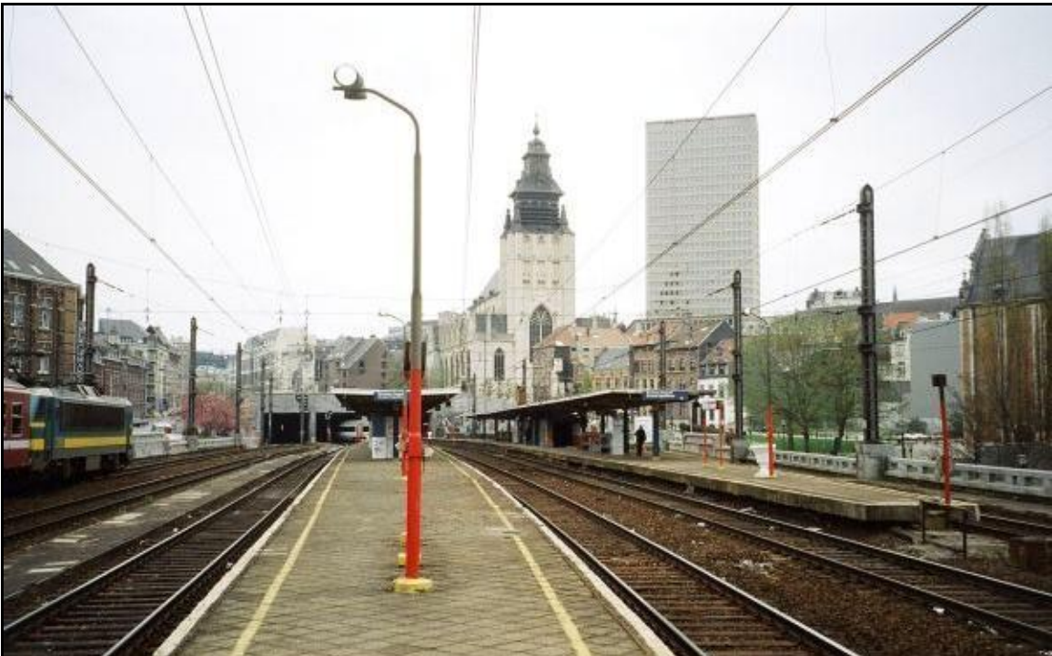
Station Brussel-Kapellekerk (vooraan) met de prachtige 12 de -eeuwse Kapellekerk en de tunnel van de Noord-Zuid Verbinding (achteraan). Een deeltje van het college is zichtbaar ter hoogte van de trein, links.