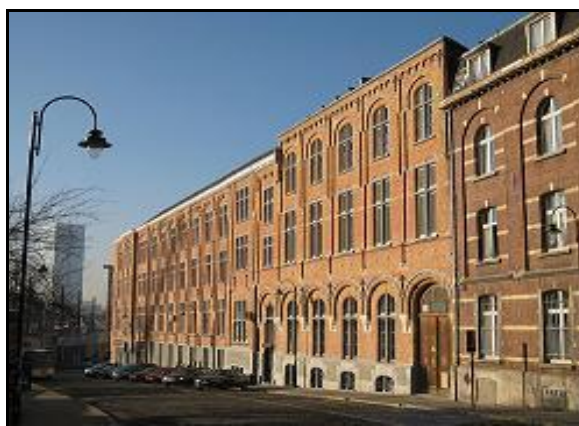
De zuidelijke (l.) en oostelijke (r.) gevels van het Sint-Jan Berchmanscollege werden in 2007-2008 gerestaureerd.