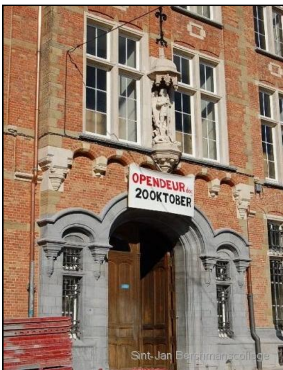
Hoofdingang van het Sint-Jan Berchmanscollege (juist na de restauratie van de voorgevel in 2007)